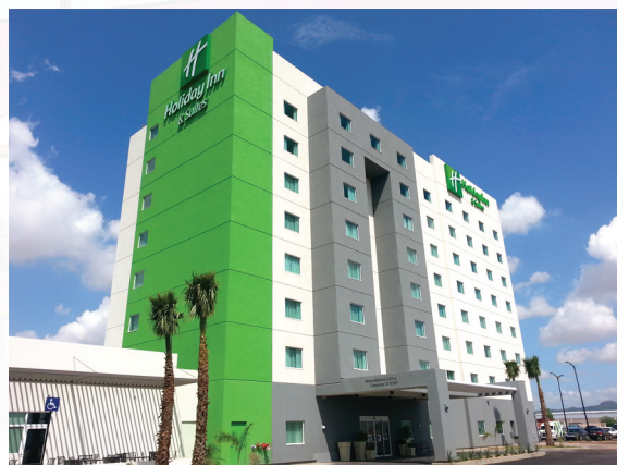
Hotel Holiday Inn

Aislaterm Placa , es un sistema de revestimiento ligero que proporciona aislamiento térmico con acabado arquitectónico. Este sistema, puede incorporar una placa de: EPS (Poliestireno Expandido convencional), BLUEBOARD® (Placa de alta densidad) o GREENBOARD® (Poliestireno Expandido de mejor anclaje). El aislamiento es adherido al exterior o bien interior del muro y recubiertas con dos capas de Base Coat reforzado con Malla Fibra de Vidrio.